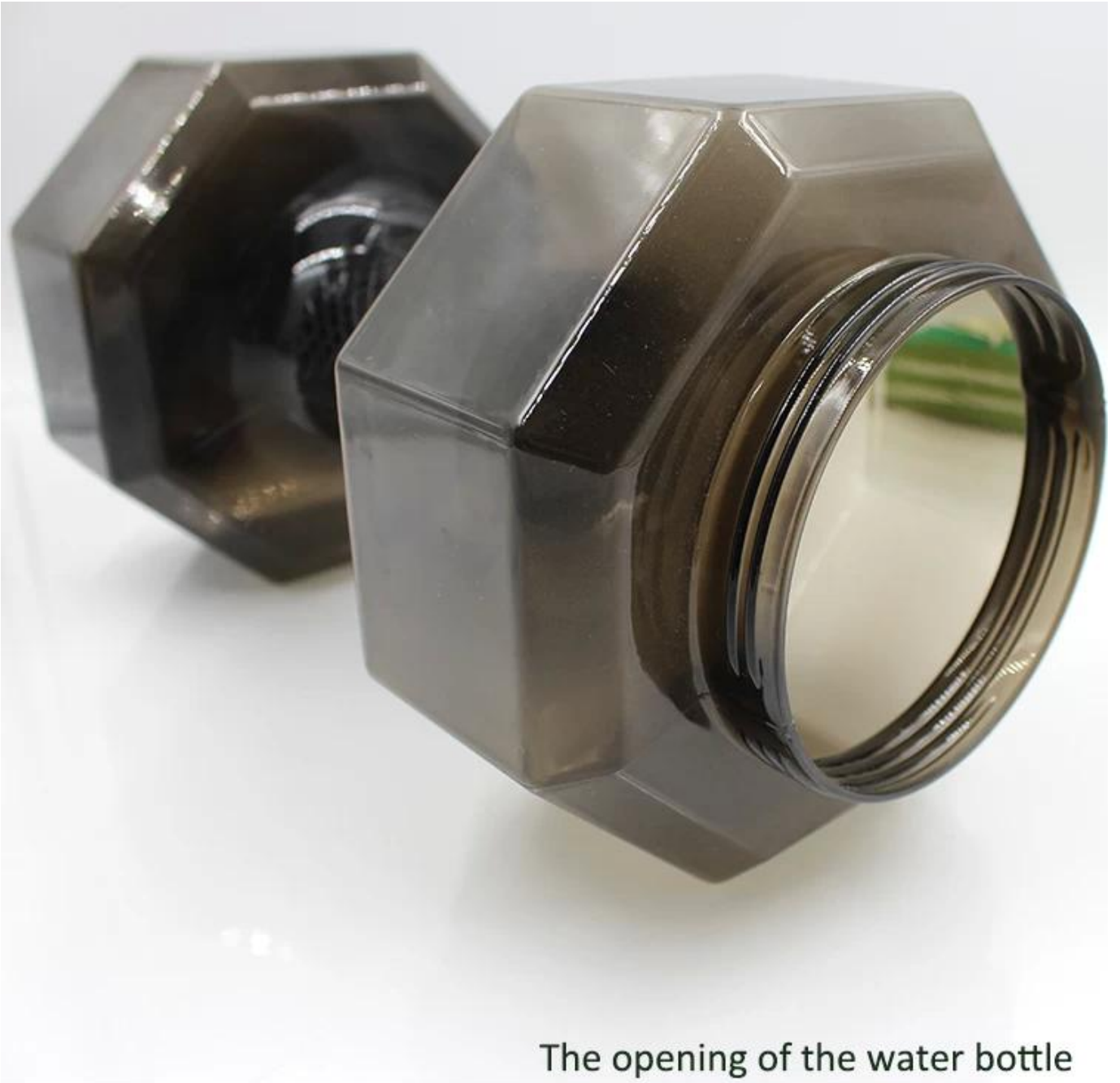
The opening of the water bottle