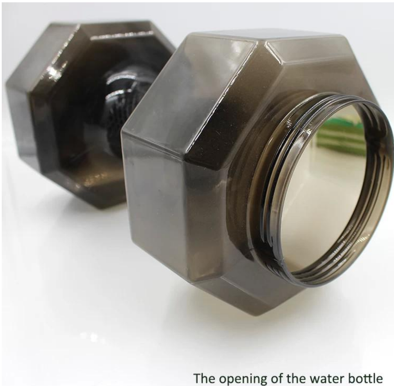
The opening of the water bottle