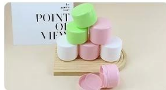
100% PP material