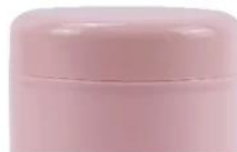
100% No leaking