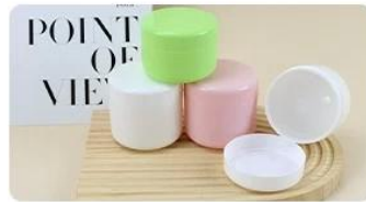
100% Improve brand expanding