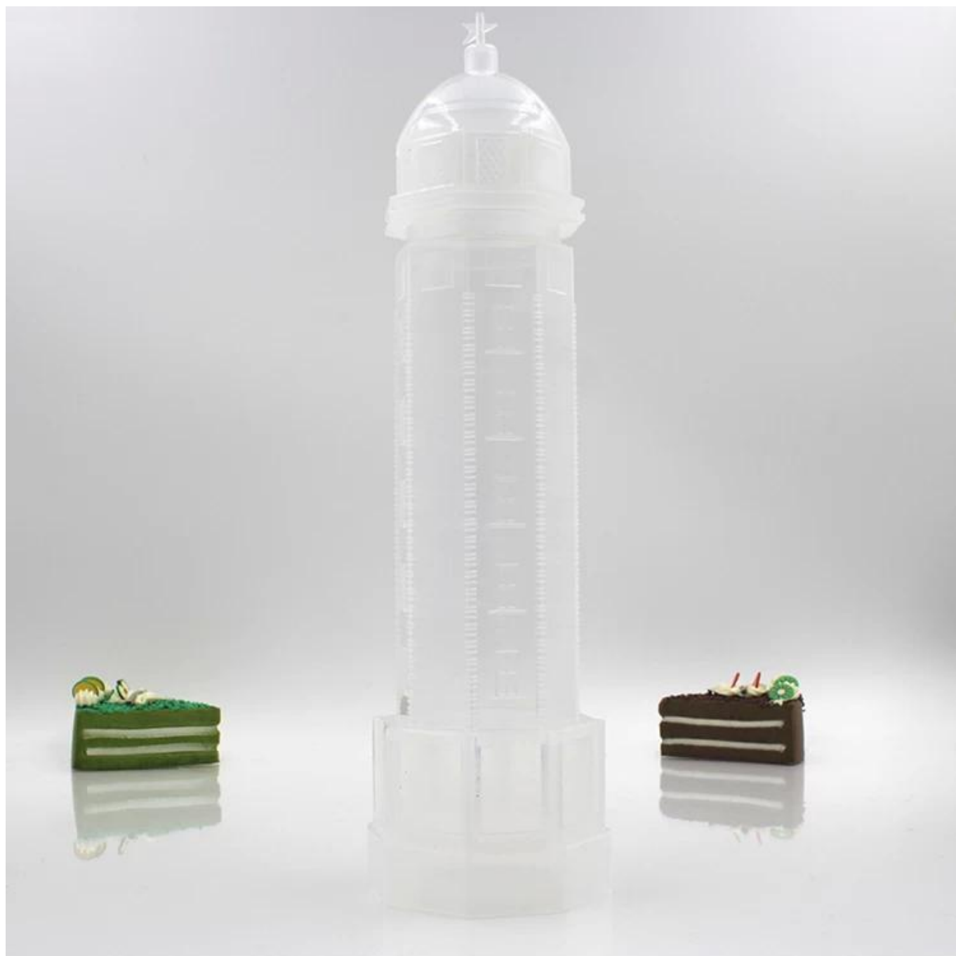
image de bouteille en forme de pagode en plastique unique