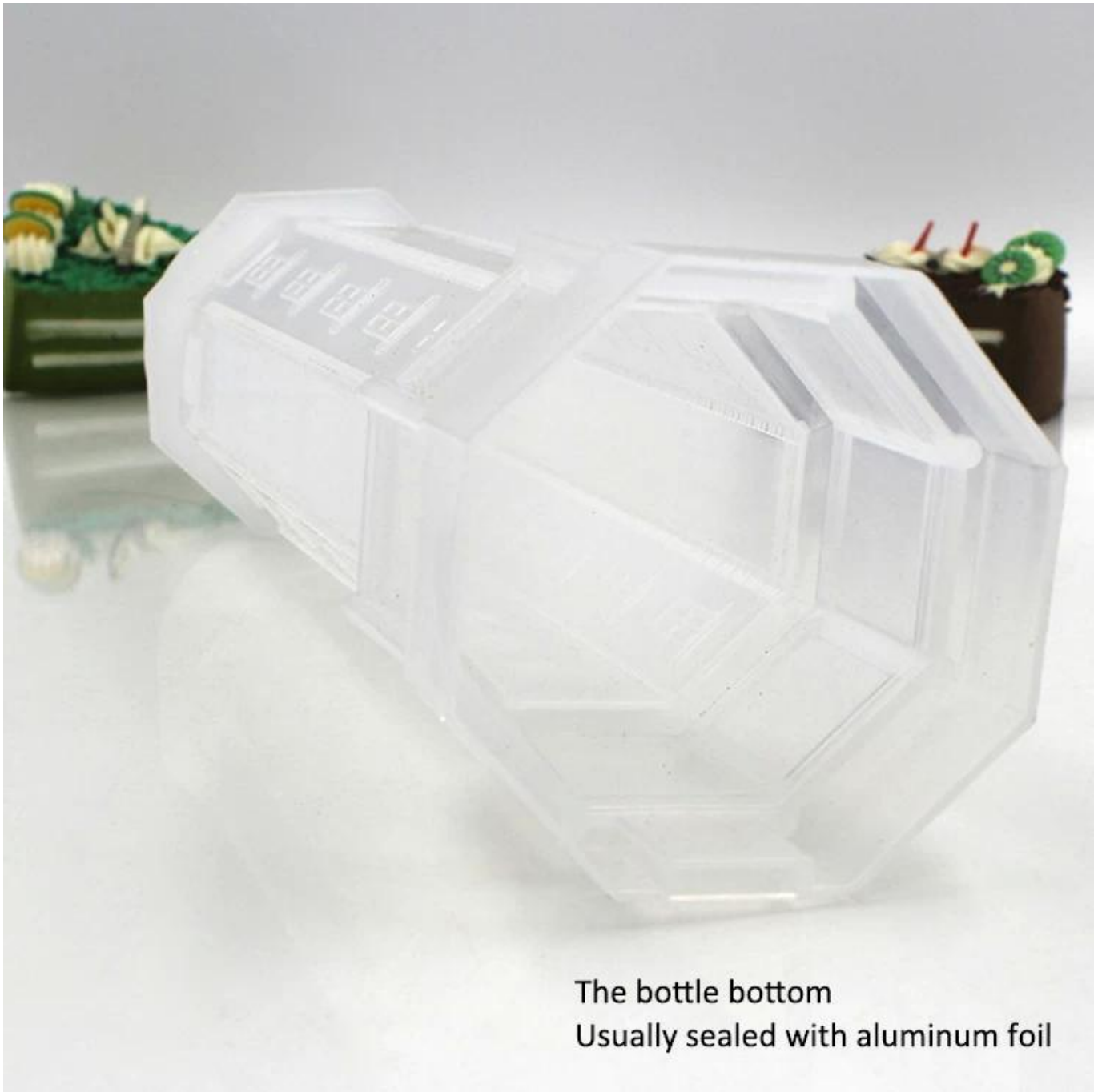
The bottle bottom Usually sealed with aluminum foil