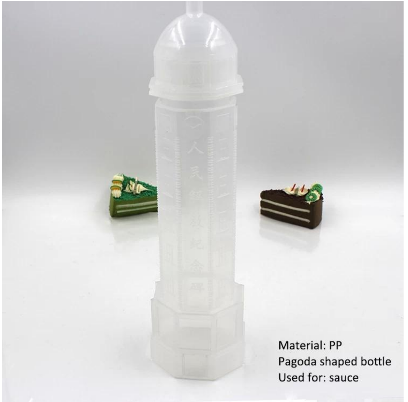
Material: PP Pagoda shaped bottle Used for: sauce