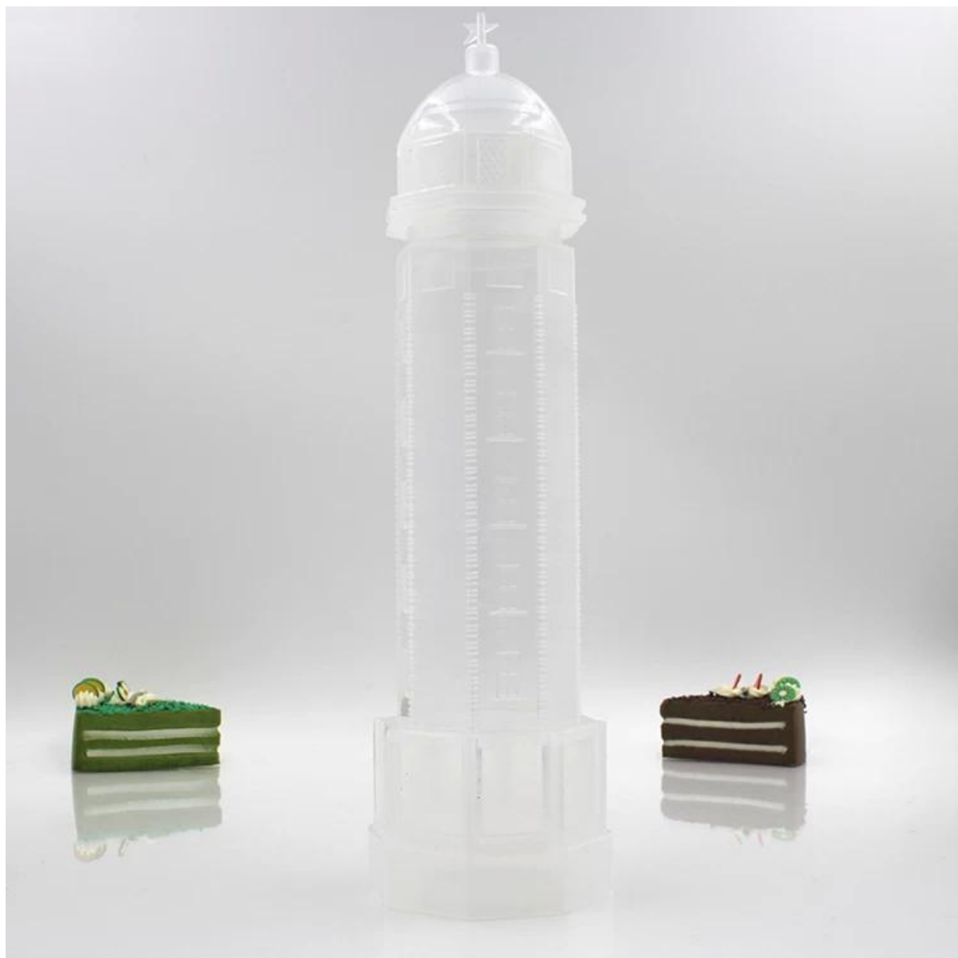
imagen única de botella en forma de pagoda de plástico